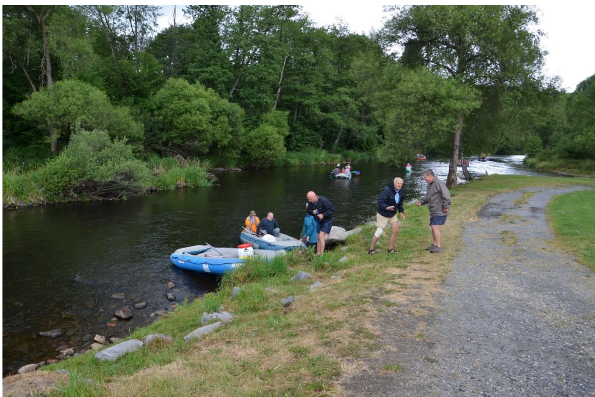
Podářilo se nám zprovoznit kolena a vystoupili jsme, někteří s pomocí.