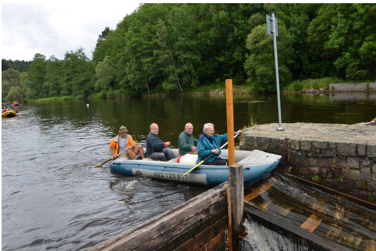
Nájezd na šlajсну (jeli tak rychle, že je ve šlajsně už fotograf asi nestihl. Škoda, vypadali neméně komicky jako předchozí posádka).