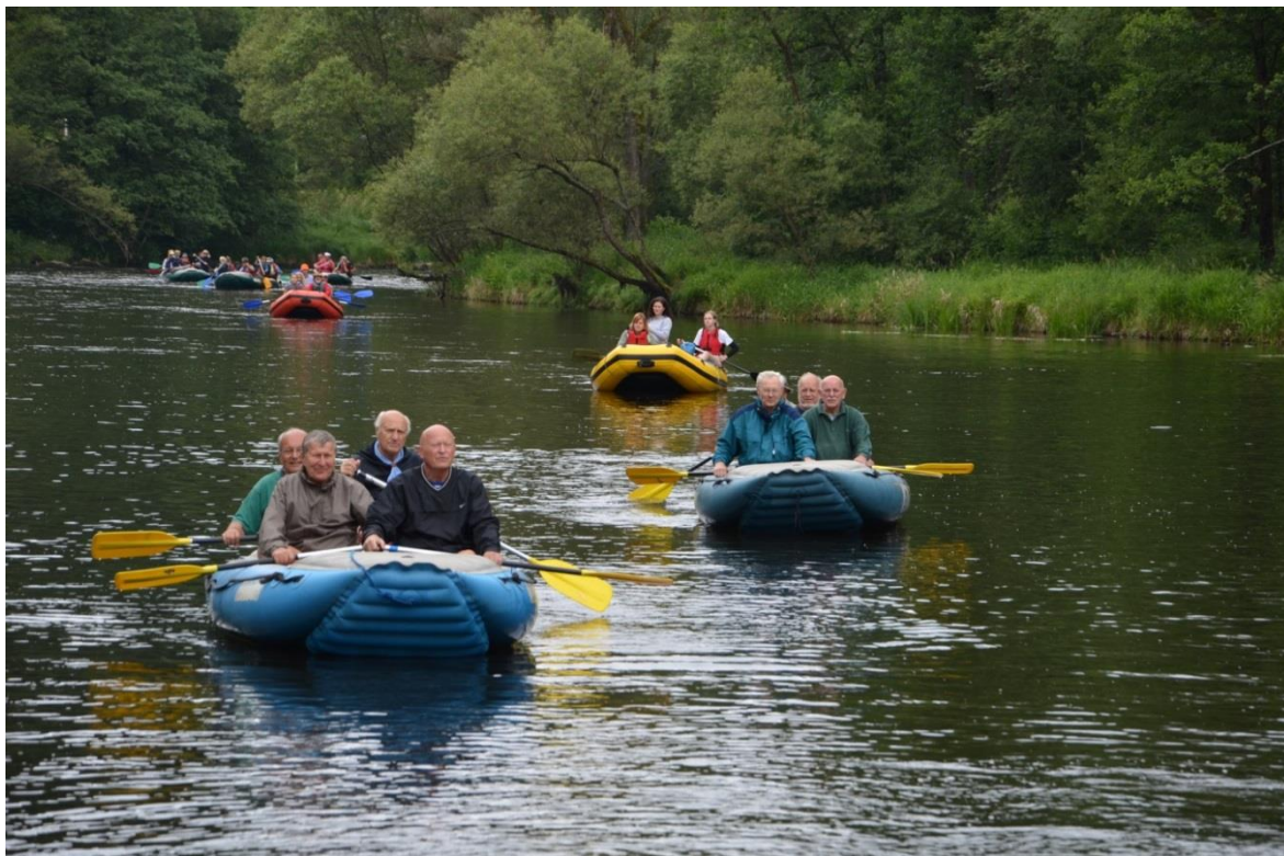
Prvostředečníci na vodě pronásledování děvčaty.

Pegas poslal fotografie, které pořídil jeho kamarád, u kterého jsme byli v chatičkách ubytováni, na šlajsně u Herbertova. Jsou zdařilé, tak mu tímto Plaváček děkuje.