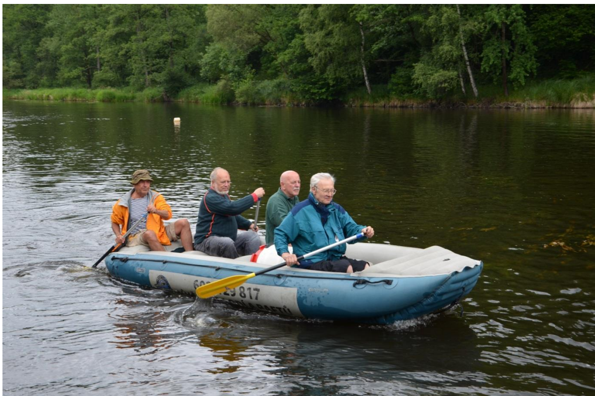
Druhá posádka: Myška, Zub, Foki, Přemík.