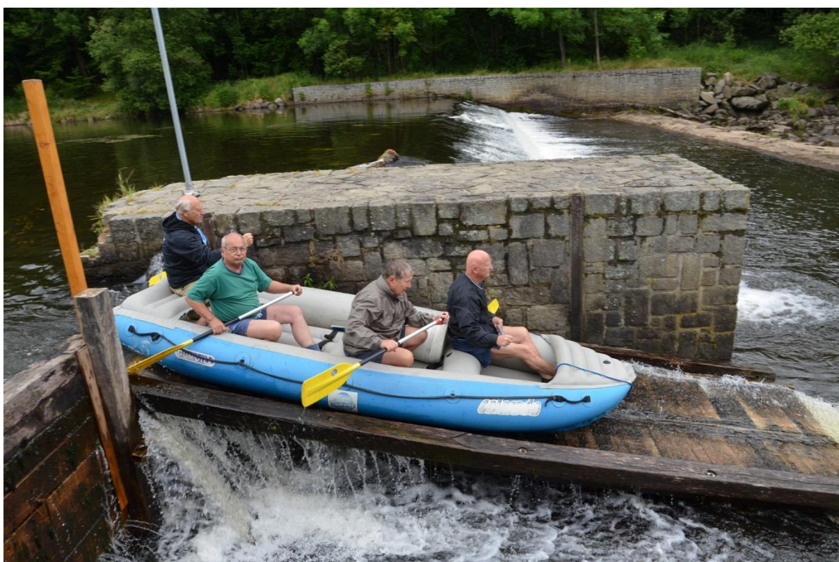
Dokonalé vedení raftu.