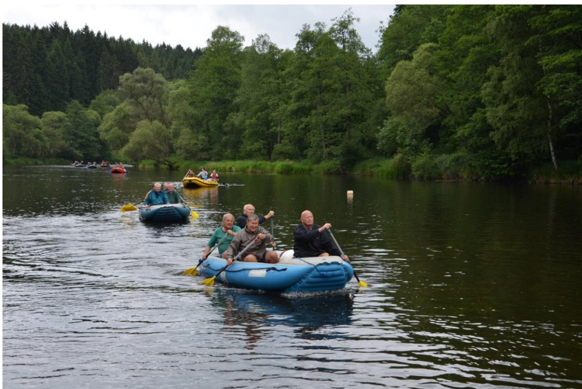
Prvostředečníci se zdarem unikají, aby nebyla ostuda.