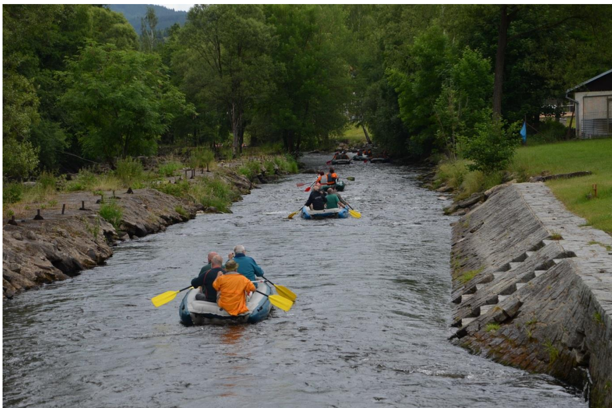
Šťastně jsme to zvládli.